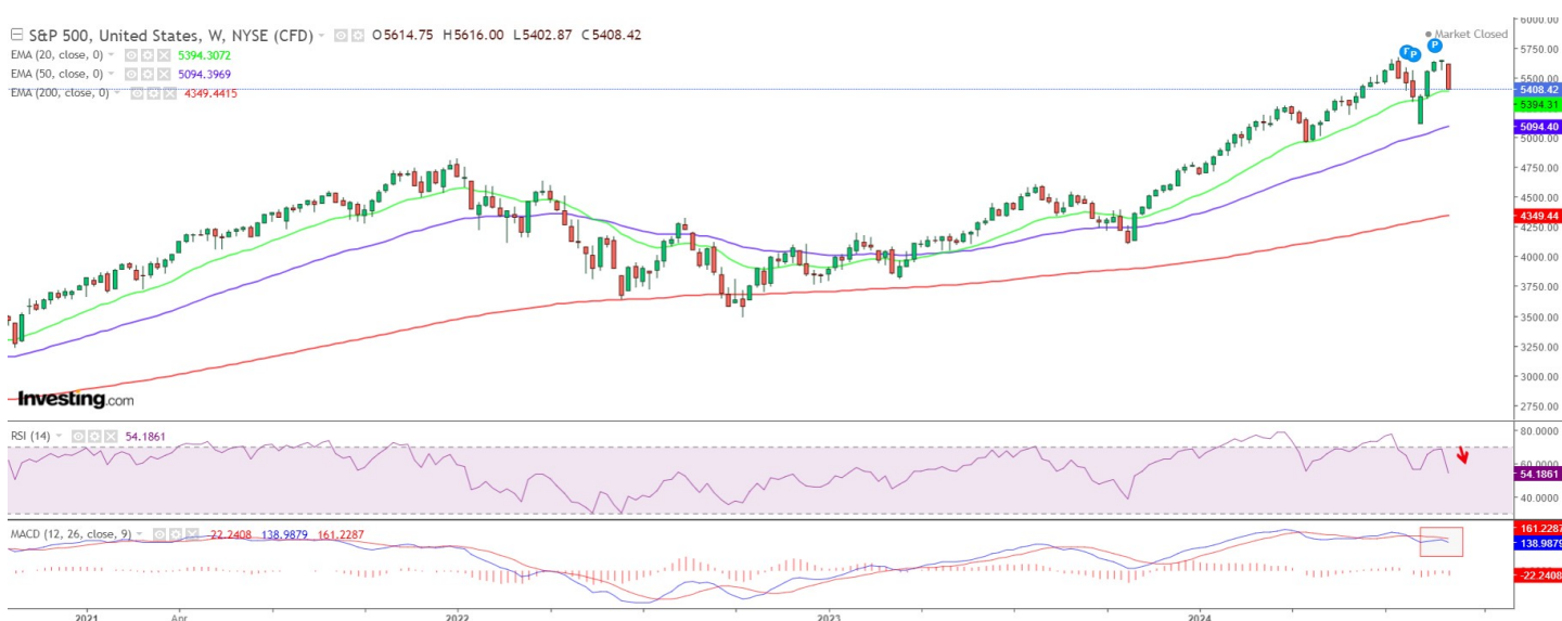
Grafic 1. S&P 500, 1 săptămână