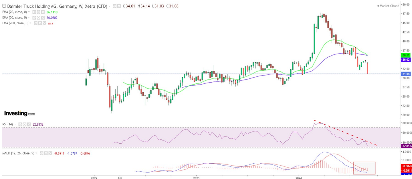
Grafic 2. Daimler Truck Holding, 1 săptămână

( https://www.opec.org/opec_web/en/press_room/7369.htm )